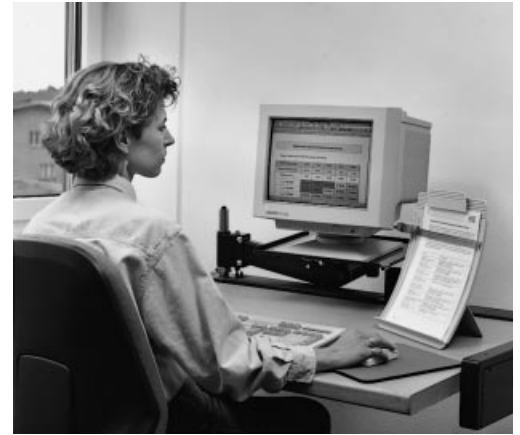
Disposizione corretta dello schermo (luce dal lato).