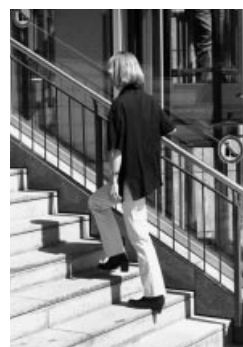
Fare le scale a piedi invece di usare l'ascensore.