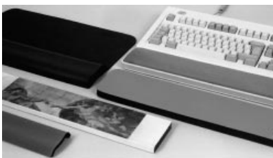
Vari tipi di poggiamani.