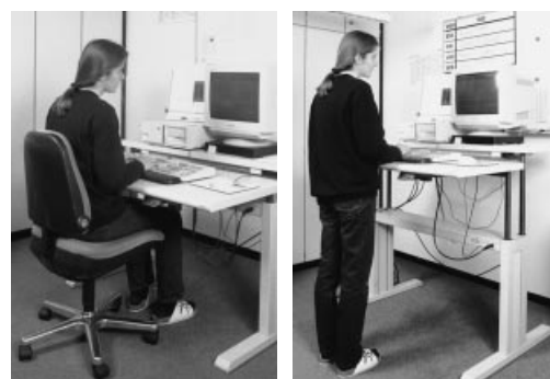
Tavolo per il lavoro al videoterminale che consente di operare sia in piedi che seduti.