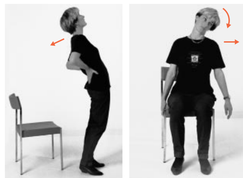
Esercizi di stretching per prevenire disturbi.

Die Broschüre richtet sich in erster Linie an Fachleute, z.B. an Personen, die in Betrieben für das Einrichten von Bildschirmarbeitsplätzen... Die Broschüre richtet sich in erster Linie an Fachleute, z.B. an Personen, die in Betrieben für das Einrichten von Bildschirmarbeitsplätzen... Die Broschüre richtet sich in erster Linie an Fachleute, z.B. an Personen, die in Betrieben für das Einrichten von Bildschirmarbeitsplätzen... Die Broschüre richtet sich in erster Linie an Fachleute, z.B. an Personen, die in Betrieben für das Einrichten von Bildschirmarbeitsplätzen... Die Broschüre richtet sich in erster Linie an Fachleute, z.B. an Personen, die in Betrieben für das Einrichten von Bildschirmarbeitsplätzen... I caratteri non devono essere troppo piccoli.